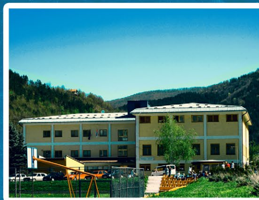
Медицински факултет Фоча