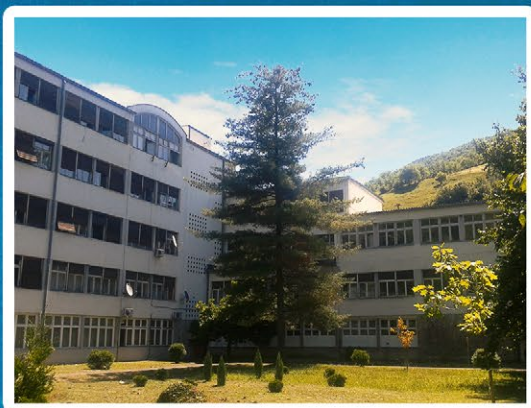
Универзитетска болница Фоча